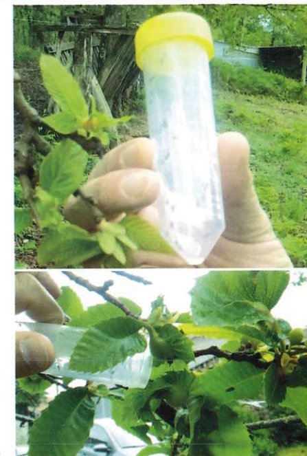
Solta de vias de Torymus sinensis

Existen ademais outros inimigos ocasionais e autóctonos da avespa que tamén atacañ as bugallas dos castiñeiros e poden axudar ao control.