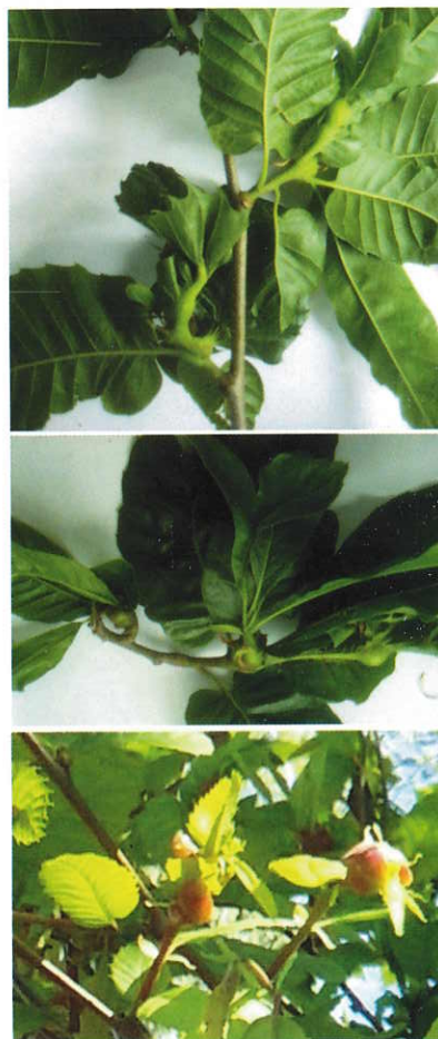
Evidencias de danos: bugallas

En Galicia o normal é atopar entre 2-5 larvas por cada bugalla.