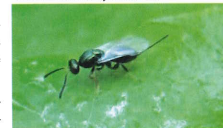
Adulto femia de Torymus sinensis